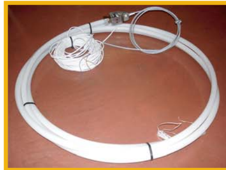
Зонд ТВК 33

При диаметре бункера от 3 до 7 метров и высотой 8 метров, советуем использовать зонды ТВК 33 или RTC .